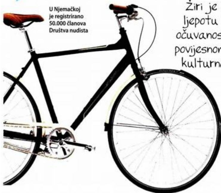
U Njemačkoj je registrirano 50.000 članova Društva nudista