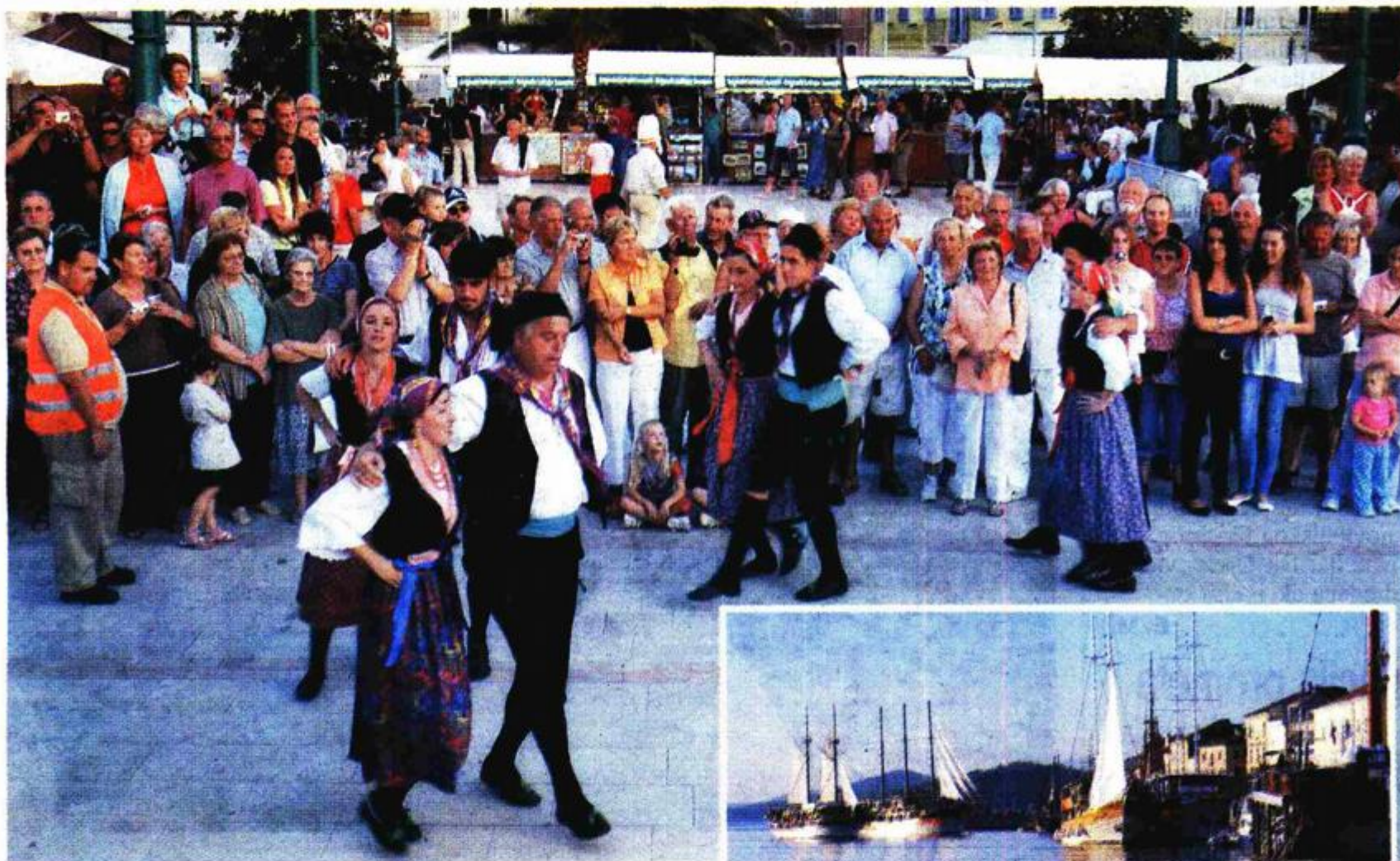
Nastup Folklornog društva Studenac iz Nerezina