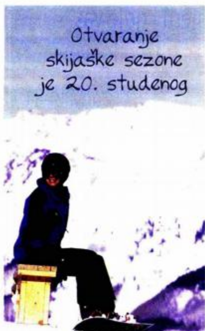
U vrijeme krize razna skijališta nude brojne dodatne pogodnosti za goste

Otvaranje skijaške sezone je 20. studenog