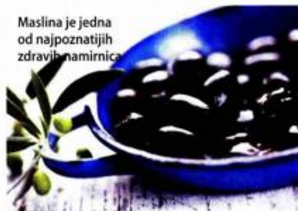
Maslina je jedna od najpoznatijih zdravih namirnica

za uvođenje redovitih letova prema Beogradu', piše u priopćenju Ureda za odnose s javnošću naše najveće avio-kompanije. Tako je neizvjesno hoće li glavni gradovi Hrvatske i Srbije sljedeće godine biti povezani zračnom linijom.