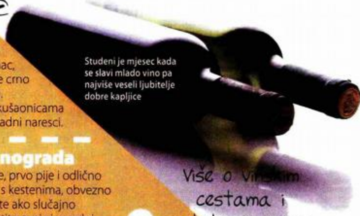
Studen je mjesec kada se slavi mlado vino pa najviše veseli ljubitelje dobre kapljice

Više o vinskih cestama i ostalim izvornim hrvatskim proizvodima na www.made-in-croatia.com.hr